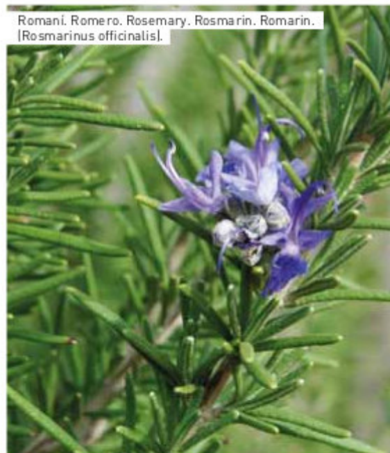
Romani. Romero. Rosemary. Rosmarin. Romarin. [ Rosmarinus officinalis ].