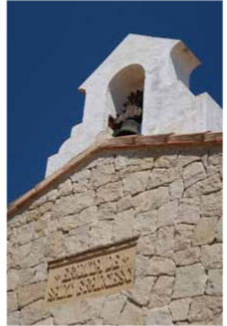
Ermita Vella. [Ermita. Chapel. Kapelle. Ermitage].

The route has an approximate duration of two hours. An hour and a half should be added if you want to hike up to the summit. Starting point of the marked path is the camping site . The path leads to the Ermita Vella (chapel), through an open forest of pine trees with occasional views of the sea. If you want to reach the summit, you have to climb up a fairly steep slope which is marked on the right side of the path. Following the circular route, which allows for panoramic views of Moraira , Morro de Toix, Salinas and Peñón de Ifach, you will arrive at a ruin set in old abandoned terraces and pass through an area with rocks of volcanic origin. Soon you will see the town of Benissa and, more to the northeast, the Montgó. Following the PR-trail you will get back to the starting point.