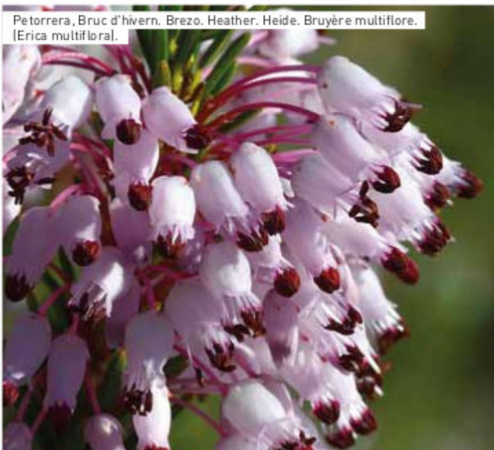
Petorrera, Bruc d'hivern. Brezo. Heather. Heide. Bruyère multiflore. [ Erica multiflora ].