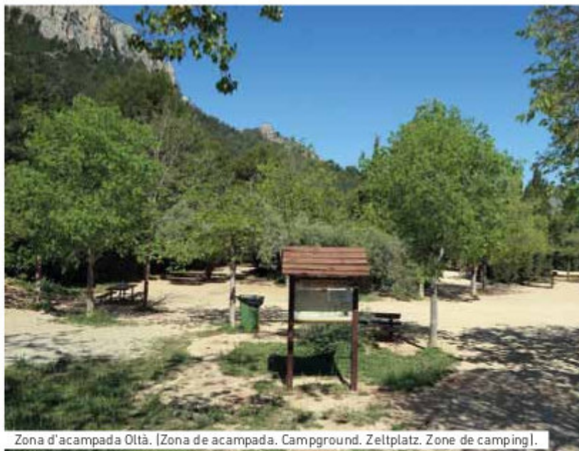
Zona d'acampada Oltà. [Zona de acampada. Campground. Zeltplatz. Zone de camping].